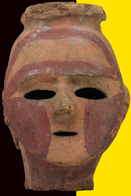
埴輪 女子頭部 (群馬県高崎市箕郷町 八幡宮前出土) 古墳時代・6世紀 東京国立博物館蔵