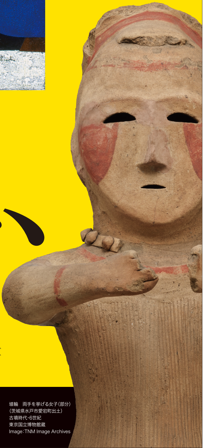
埴輪 両手を挙げる女子(部分) (茨城県水戸市愛宕町出土) 古墳時代・6世紀 東京国立博物館蔵

□主催/やないづ町立齋藤清美術館 □後援/福島民報社、福島民友新聞社、NHK福島放送局、福島テレビ、福島中央テレビ、福島放送、テレビユー福島、ラジオ福島、ふくしまFM、エフエム会津、喜多方シティエフエム、只見川電源流域振興協議会、奥会津五町村活性化協議会、只見川ライン観光協会、極上の会津プロジェクト協議会 □特別協力/独立行政法人国立文化財機構文化財活用センター、東京国立博物館、九州国立博物館 □協力/福島県立博物館