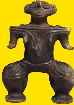
遮光器土偶(青森県つがる市森田町床舞出土) 縄文時代晩期・前1000~前400年 東京国立博物館蔵(重美)

斎藤清が東京国立博物館で実際に目にした土偶・埴輪の名品と、それらをテーマにした作品が一堂に。「国宝級の埴輪を手にとって見せてもらった」—古代の造形を目の当たりにした画家の感動を体感しながら、多彩な魅力を持つ作品をご覧ください。