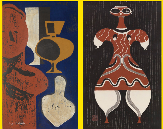
上から:ハニワ 1953年 土偶 1959年 福島県立美術館蔵 ハニワ(1) 1952年 左:ハニワと土器(J) 1952年 右:土偶(B) 1958年 ※所蔵の表記がないものはすべて斎藤清美術館蔵

■観覧料(1人) 大人700円(団体600円) 高校・大学生500円(団体400円) 中学生以下 無料