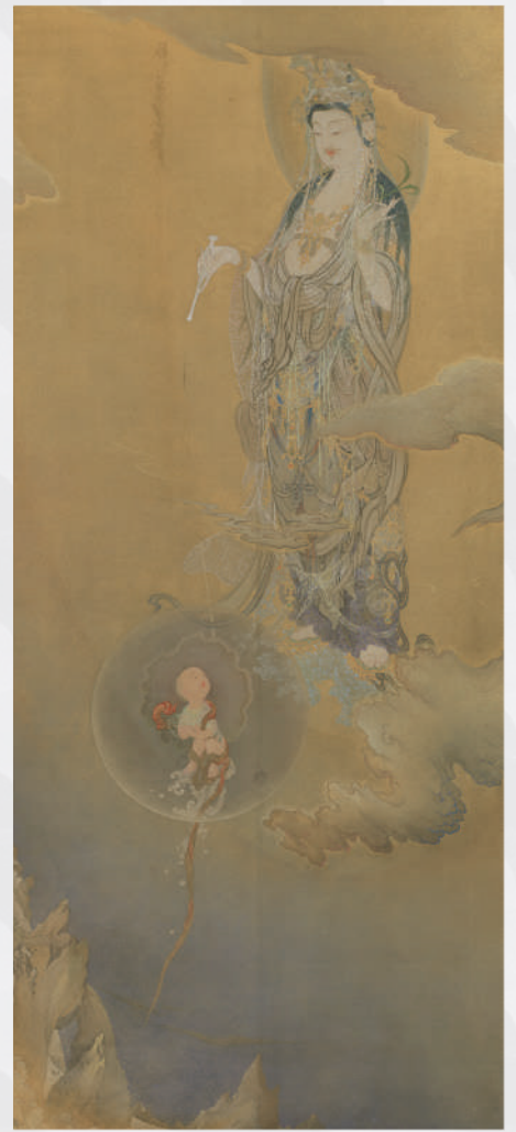
狩野芳崖《悲母観音》1888年 東京藝術大学蔵、重要文化財