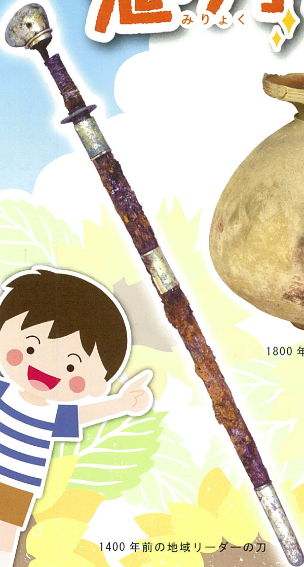
1400 年前の地域リーダーの刀