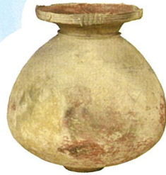
● 壺 (明和町金剛坂出土) 弥生時代 東京国立博物館