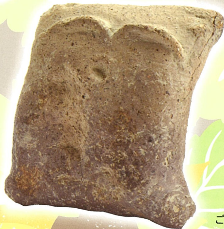
2500 年前の ご先祖さまの顔