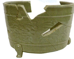
♡ 安養寺跡出土 青磁香炉 鎌倉時代 明和町