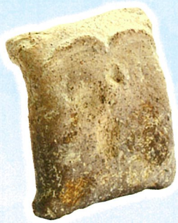
★ 西出遺跡出土 人面土版 縄文時代 三重県埋蔵文化財センター

齋宮跡のまわりには、たくさんの文化財があります。発掘調査で見つかったもの、古くから伝えられてきたもの、いろいろな記録に残されているもの、それらは齋宮がまだなかったころ、あったころ、なくなった後の豊かな歴史を伝えています。今年、明和町が生まれて60年、この機会にわたしたちの地域の文化に親しむ機会としましょう。