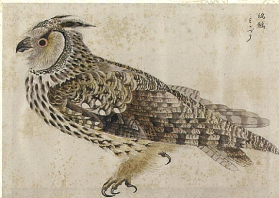
鳥類図(写真は「ミヅク」) 19世紀 山本溪愚筆 本館蔵(堀田コレクション)