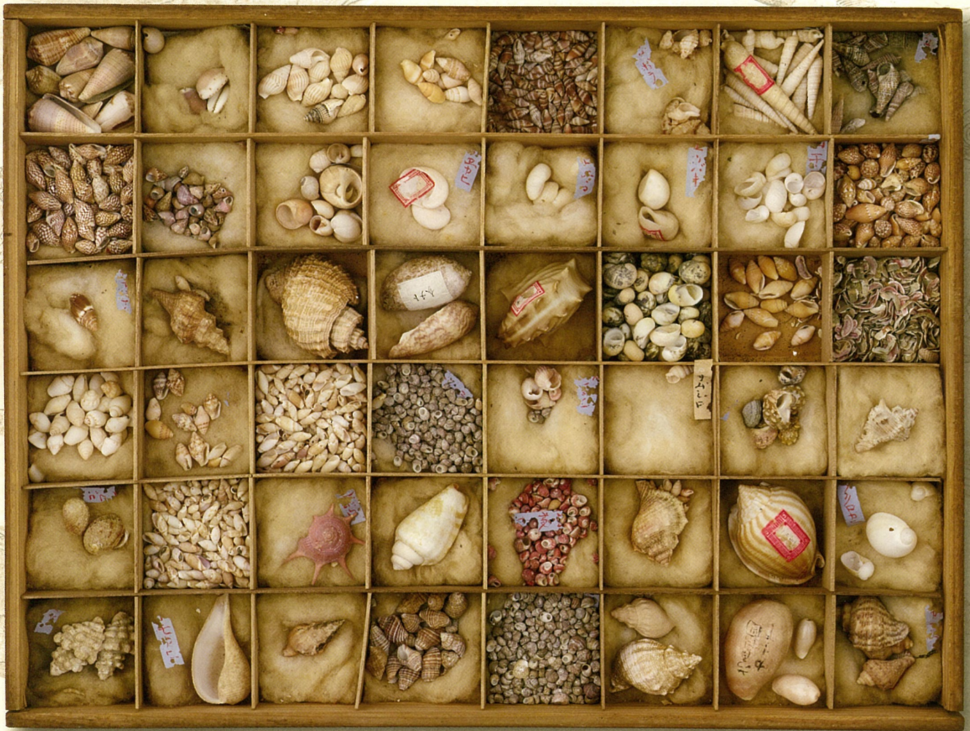
貝類標本 19世紀 大阪市立自然史博物館蔵

平成30年(2018年) 4月25日水 ～ 6月18日月 [火曜日休館] 5月1日(火)は開館