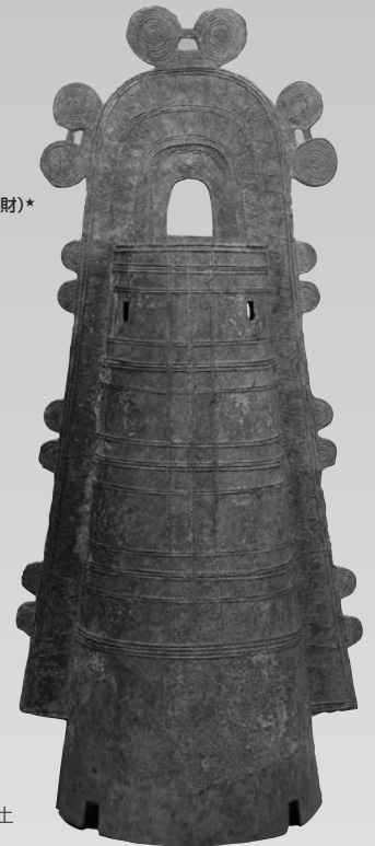
とっせんちゅうしきどうたく 突線鈕式銅鐸 和歌山県みなべ町出土 東京国立博物館蔵

本展では、高さ1mを超える銅鐸から、6cm程度の小銅鐸までを比較展示します。また、シカや魚、迷路のような流水文など、銅鐸の意匠にもぜひご注目ください。