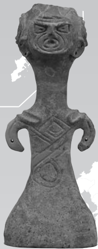
どくがた ようき 土偶形容器 長野県上田市腰越出土 東京国立博物館蔵