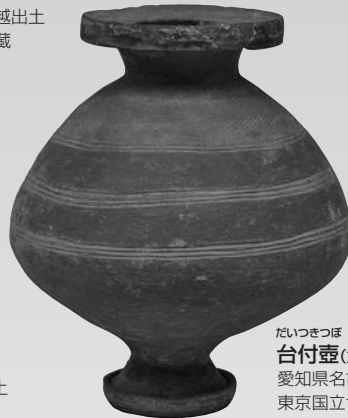
だいづきつぼ 台付壺(重要文化財) 愛知県名古屋市長蔵貝塚出土 東京国立博物館蔵