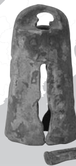
しょうどうたく 小銅鐸(糸島市指定文化財)* 浦志遺跡A地点出土 (福岡県糸島市) 伊都国歴史博物館蔵