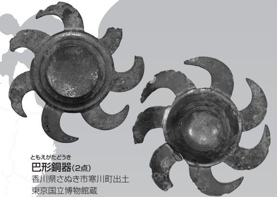
ともえがたどうき 巴形銅器(2点) 香川県さぬき市寒川町出土 東京国立博物館蔵

「本当に同じ時代の土器?」と疑問に思うような個性たっぷりの弥生土器や、教科書で見たような大きな銅鐸と北部九州などで見られる小さな銅鐸との対比展示、糸島出土品の里帰り展示など、盛りだくさんの内容となっています。