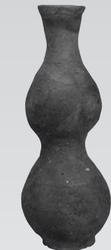
ひさごがたつぼ 瓢形壺 茨城県筑西市女方出土 東京国立博物館蔵