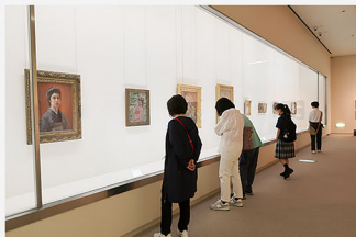
鹿児島市立美術館 「開館70周年記念 没後100年 黒田清輝とその時代」 会場風景