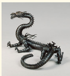
自在龍置物 明珍宗察作 江戸時代・ 正徳3年(1713)