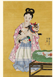
童児擁猫図(部分) 山本栞谷筆 明治時代・19世紀