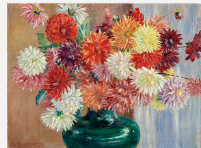
ダリア 黒田清輝筆 大正2年(1913) カンバス・油彩

令和6(2024)年度事業では、鹿児島市立美術館に、「ダリア」を含む43件を貸し出しました。