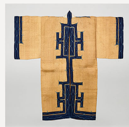
アットゥシ(樹皮衣) 北海道アイヌ 19世紀