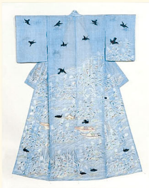
帷子 淡浅葱麻地御所解(鶺鴒)文様 江戸時代・18～19世紀 京都国立博物館蔵