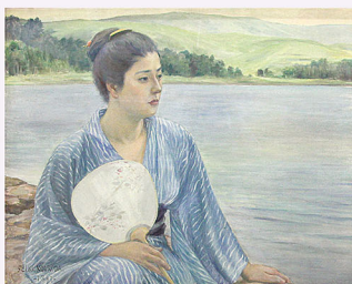
重要文化財 湖畔 黒田清輝筆 明治30年(1897)