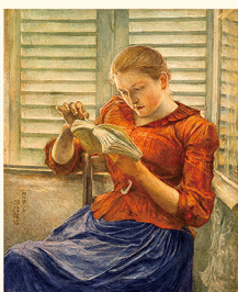
読書 黒田清輝筆 明治24年(1891) カンバス・油彩