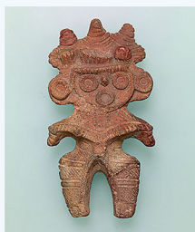
みみづく土偶 縄文時代(晩期)・前1000~前400年 埼玉県鴻巣市滝馬室出土