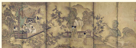
宮女図屏風 雪村周繼筆 室町時代・16世紀 京都国立博物館蔵