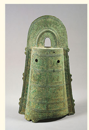
銅鐸 弥生時代・2～3世紀 静岡県浜松市浜名区三ヶ日町釣荒神山出土 奈良国立博物館蔵