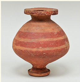
重要文化財 台付壺 弥生時代(後期)・1～3世紀 愛知県名古屋市長島貝塚出土 徳川頼貞氏寄贈