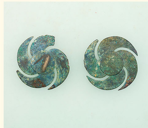
巴形銅器 古墳時代・5世紀 山口市 赤妻古墳出土