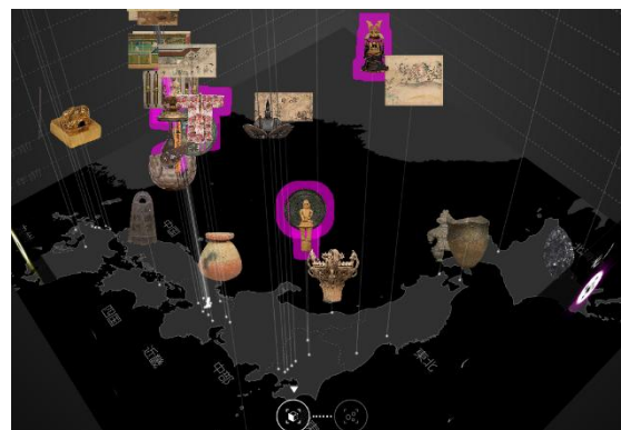
縦軸に年代、底面に日本地図を配置