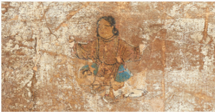
B 11歳、雲のように空に浮かぶ(第1面) Age 11: Powers of Levitation