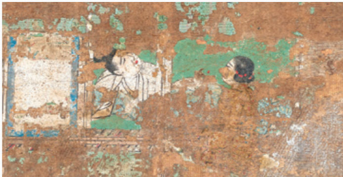
D 16歳、父の用明天皇を見舞う(第3面) Age 16: Illness and Demise of Emperor Yomei