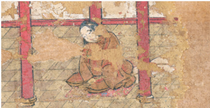
C 12歳、百済の賢者、日羅と会う(第10面) Age 12: Venerated by a Sage from Baekje