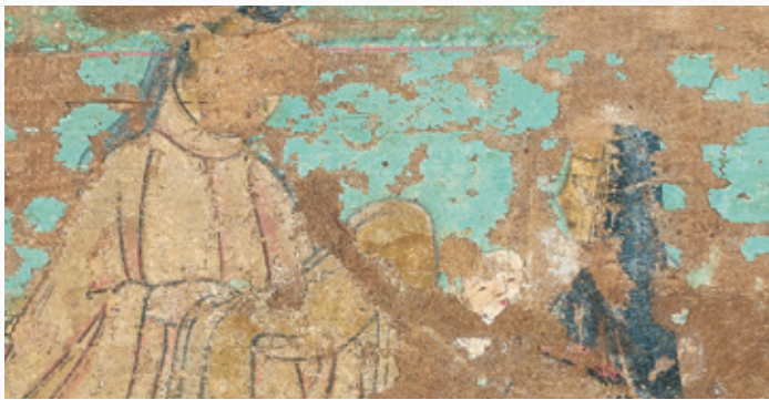
A 1歳、太子の誕生を祝う宴(第1面) Age 1: Banquets to Celebrate the Prince's Birth

This year, while the Illustrated Biography of Prince Shotoku is exhibited at the Gallery of Horyuji Treasures, the 8K Art Viewer will also be on display in an interactive area. Visitors will have a chance to learn about the legendary life of Prince Shotoku and examine this ancient masterpiece as never before possible.