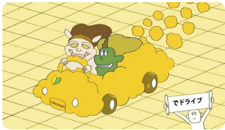
びじゅチューン!「風神雷神図屏風デート」

NHK Eテレ「びじゅチューン!」でおなじみの「風神雷神図屏風/夏秋草図屏風」、「松林図屏風」、「八橋時絵螺鈿硯箱」の世界で遊んでみよう。ほんものそっくりにつくられた複製や映像をつかった「なりきり」体験が楽しめます。