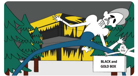
びじゅチューン!「住んでます、八橋時絵硯箱」