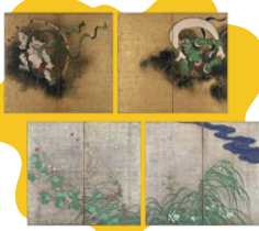
重要文化財 風神雷神図屏風 尾形光琳作 江戸時代・18世紀 重要文化財 夏秋草図屏風 酒井抱一筆 江戸時代・19世紀

風神と雷神。ふたりがデートする屏風の表と裏の関係は? 屏風の前に立つと雷が鳴り、風が吹く。その時、屏風の裏側で何かが起こる!