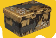
国宝 八橋時絵螺鈿硯箱 尾形光琳作 江戸時代・18世紀