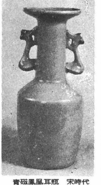
青磁鳳凰耳瓶 宋時代