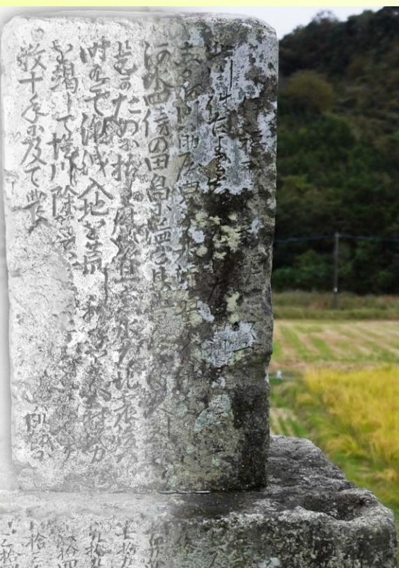
井替川改修記念碑 (宮崎県延岡市下伊形町)