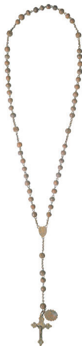
重要文化財 ロザリオ