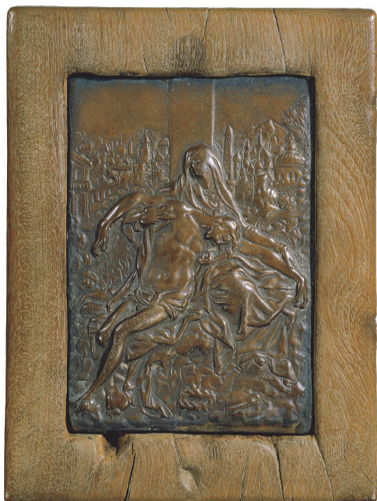
重要文化財 板踏絵 キリスト像(ピエタ)