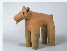
埴輪 犬 群馬県伊勢崎市境上武士出土 古墳時代・6世紀、東京国立博物館蔵 (2018年度大分県立美術館貸与品)