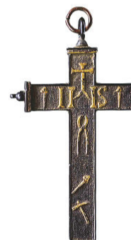
重要文化財 十字架(聖遺物函)