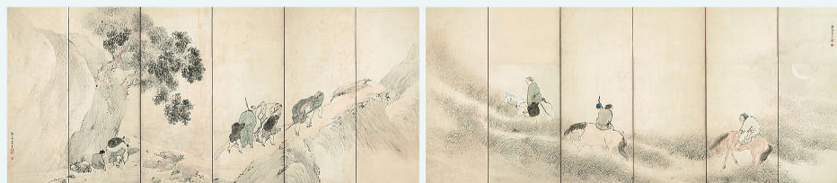
重要文化財 山野行楽図屏風 与謝蕪村筆 江戸時代・18世紀、東京国立博物館蔵 (2017年度福島県立博物館貸与品)